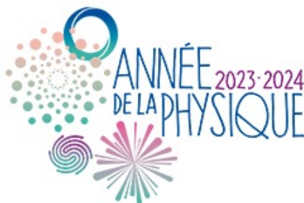
LOGO année de la physique